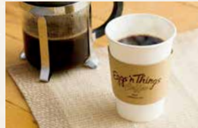
100%コナコーヒー [Hot or Iced] 700 yen (756yen)

世界で流通しているコーヒー総生産量の1%未満という希少なコナコーヒー豆を深めに煎ることでコクと優しい苦味を引き出しました