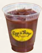
Acai Banana Yogurt Drink アサイーバナナ ヨーグルトドリンク