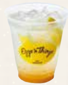
Ginger Lemon Squash ジンジャー レモンスカッシュ