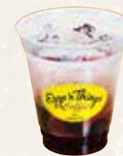
Berry & Cassis Squash ベリー&カシス スカッシュ