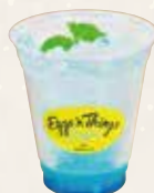
Salty Lychee Squash ソルティライチ スカッシュ