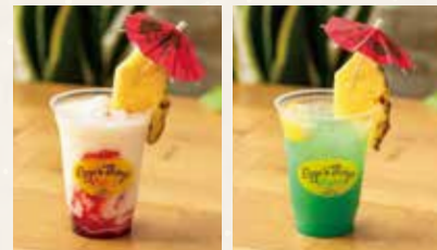
Virgin Lava Flow