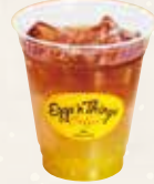
Plantation Iced Tea プランテーション アイスティー